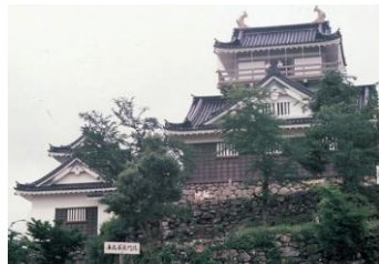
▲大野城 昭和45年6月20日