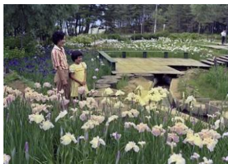
▲海浜公園・花菖蒲 昭和53年6月下旬